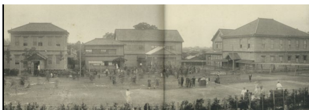
大正 9 (1920) 年頃 東京医学専門学校校舎 (右) と附属博済病院 (左)

東京医学専門学校の設立にあたっては、学生が総退学して経営危機に陥った日本医学専門学校と東京医学講習所の学生を救済しようと、立教大学により医学部の設立が計画されましたが、第一次世界大戦で寄附金が集まらず断念した経緯もあります。