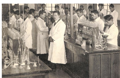
【東京物理学校内に東京医学講習所を開設】 薬物医化学実習