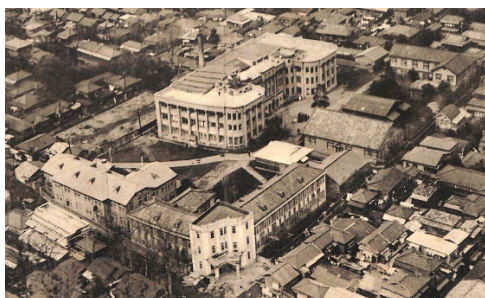
昭和 17 (1942) 年 東京医学専門学校

学校教育法が昭和 22 (1947) 年に制定され、新制医科大学として本学が再発足するにあたり、病床数不足が問題となりました。昭和 24 (1949) 年 10 月に霞ヶ浦病院 (現茨城医療センター) を開設して病床数を増やしたことにより、昭和 27 (1952) 年 2 月、新制の東京医科大学が認可されました。