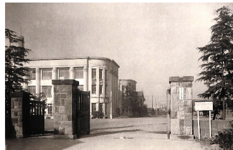
昭和 29 (1954) 年 東京医科大学