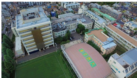
令和 3 (2021) 年現在

その後、大学院設置、看護専門学校 (後に看護学科設置により閉校) と霞ヶ浦看護専門学校の設立、八王子医療センター開設、医学総合研究所 (初代所長: 中嶋宏 WHO 名誉事務局長・第 4 代 WHO 事務局長・本学卒) 開設、看護学科設置など、施設設備や組織が拡充されて現在に至っており、学生数は 1,500 名を超え、職員数は全施設で 6,000 名弱となっています。