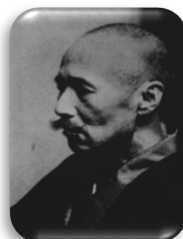
森林太郎（森鷗外）氏