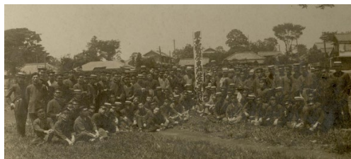
大正 6 (1917) 年 6 月 校地購入